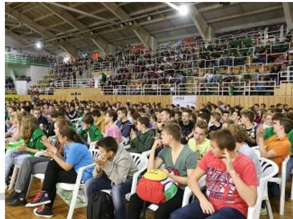
Teltház, a házigazdák kitettek magukért

Info: Idén, csakúgy, mint tavaly májusban kerül sor az éves Fair Play díjátadó gálára.