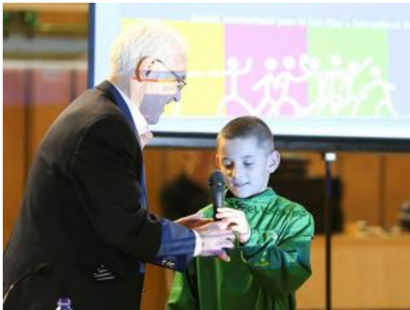
Egy fiatal FTC birkózó mond példát a Fair Play-re

Zárszóként a következőt kérte a fiataloktól: "Legyetek becsületesek, legyetek jó sportolók, és tanuljatok. Készüljetek doppingmentesen, és tiszteljétek szüleiteket, nevelőiteket. Vegyetek példát olyan ferencvárosi sportolókról, mint Kökény Beatrix, vagy Magyar Zoltán!"