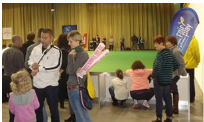
Fair Play molinók mindenfelé