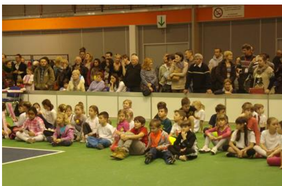
Rengeteg gyerek vett részt az eseményen